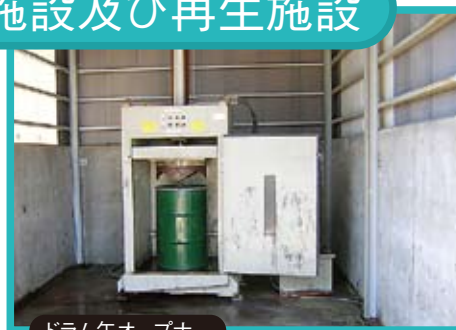
ドラム缶オープナー