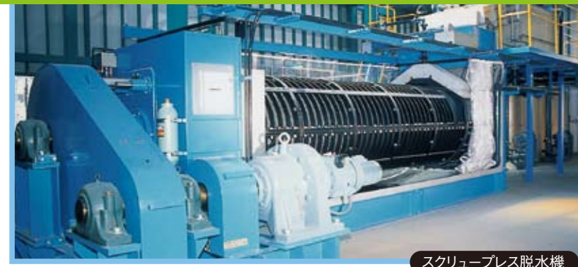
スクリープレス脱水機