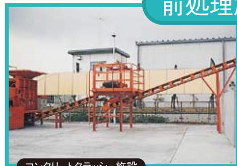
コンクリートクラッシュ施設