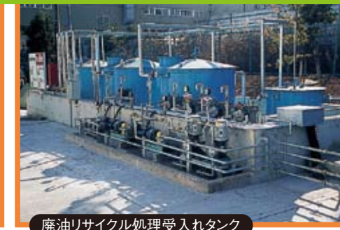
廃油リサイクル処理受入レタンク