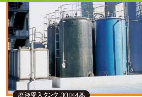
廃液受入タンク 30t×4基