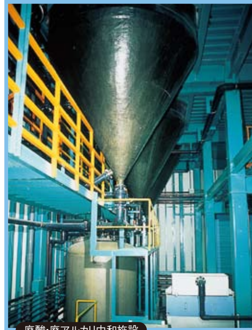
廃酸・廃アルカリ中和施設