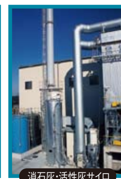
消石灰・活性炭サイロ