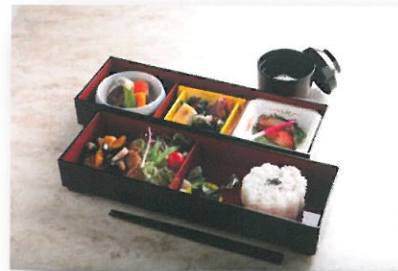
塗容器シリーズ / 1,500円(税込)