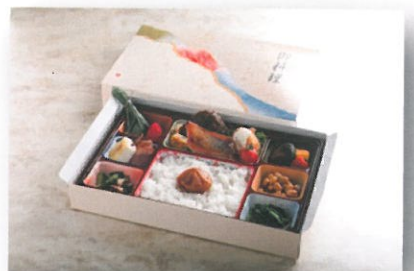
使い捨て容器シリーズ / 1,000円(税込)