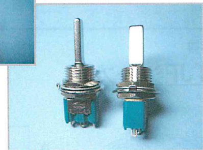
ツマミ長さ/17mm、ツマミ幅/6mm、取付/M12

共通仕様 定 格 AC125V 6A、AC250V 3A 標準付属品 3TJW, 3PJW ナット、ワッシャー、Oリング