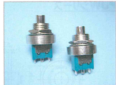
ボタンジク径/6.2Φ、取付/M12、防水性/内部パッキン、外部パッキン

3PJWシリーズは、高接触信頼性プッシュ“3Pシリーズ”の防水機能を備えた、ジャンボボタンジクのプッシュスイッチです。