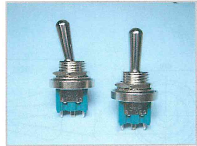
ツマミ長さ/17mm、取付/M12、防水性/内部パッキン、外部パッキン

3TJWシリーズは、高接触信頼性トグル“3Tシリーズ”の防水機能を備えた、ジャンボノブタイプのトグルスイッチです。