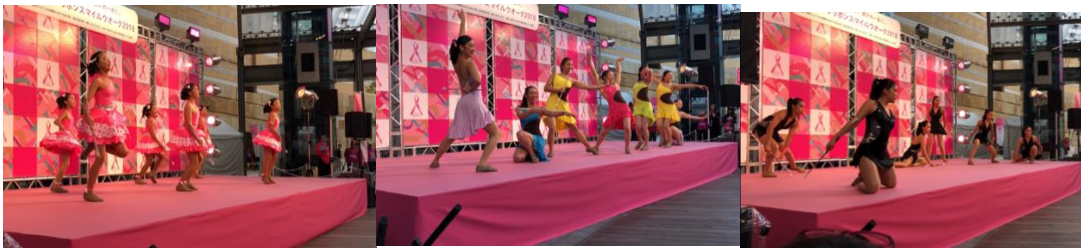
（自由が丘バトンクラブ 小学生チーム）

六本木ヒルズアリーナでは、自由が丘バトンクラブの2チームと TWIRL i がそれぞれ演技をされました。