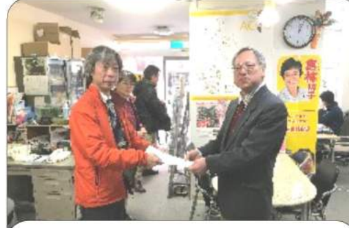
共産党国政事務所長に要請

この「定員合理化計画」が来年度末で終了となることから、政府は新たな「定員合理化計画」を策定しようとしています。京都国公は、新たな定員削減計画に反対し、国公労連が取り組む「公務・公共サービス拡充を求める請願署名」への賛同と