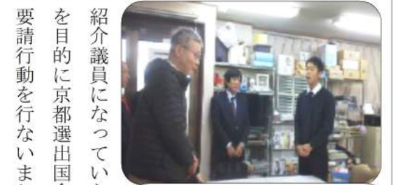
要請する新庄副議長 山井事務所にて (秘書が対応)

要請の結果、紹介議員になることを承諾をした議員3名、後日回答する議員が2名、それ以外は、3月25日現在で未回答です。要請結果の詳細は左上の表を参考にしてください。京都国公は、こうした結果をふまえ、4月15日に行われる国公労連統一行動において再度、地元(京都)選出国會議員要請を行う予定です。